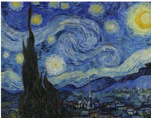
ゴッホ「星月夜」 亡くなる前年に、精神病院で療養中に描かれた作品