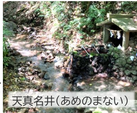
天真名井(あめのまない)

福岡県宗像市の大島は、七夕伝説発祥の地とされています。この島には宗像大社中津宮があり、(宗像三女神の次女のたぎつひめ様をお祀り)境内に流れている川は「天の川」と名づけられています。その川を挟んで2つの神社があり、それが織女神社(おりひめ)と牽牛神社(ひこぼし)。夜空と同じ配置で神社が鎮座している所にロマンを感じますね。右は、霊水であり湧き水、天真名井で、天の川と合流します。毎年8月7日は七夕祭が開催されます。日本各地には七夕にまつわるおまつりや、七夕仕様のご朱印を頂ける神社やお寺があるので、訪ねてみるのも良いですね！