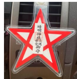
五芒星の交通安全御守り(車用)

西洋・東洋において五芒星(中心が正五角形で一筆書きできる星形)は魔除けとされてきました。安倍晴明の家紋や御札は五芒星です。