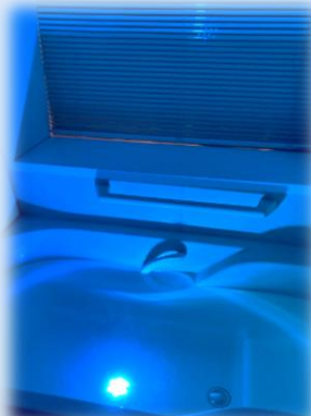
まるでグランブルーの世界です。

色に心理効果があるのは知られていますが、体への生理作用もあるのです。暖色の赤はアドレナリンを分泌し、血流をアップさせ興奮を促し(よって体感が熱くなる)、青はその反対で副交感神経に作用し、脈拍や体温を下げる効果があります。赤と青では体感的に2度位の差があると言われるので、夏に青を用いるのは、理に適っているのです。